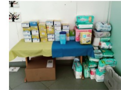
Die Spenden in beiden Schulhäusern

für Ihre Mithilfe und Ihr Engagement aufgrund unserer Hilfsaktion möchte ich von ganzem Herzen meinen Dank aussprechen. Die Sachspenden konnte ich nach Augsburg fahren und dem Malteser Hilfsdienst überbringen.