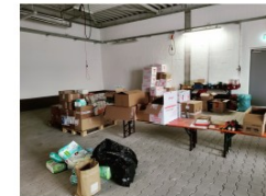
Lagerhalle des Malteser Hilfsdienstes in Augsburg

Dort werden alle Sachspenden gesammelt, sortiert und verpackt.