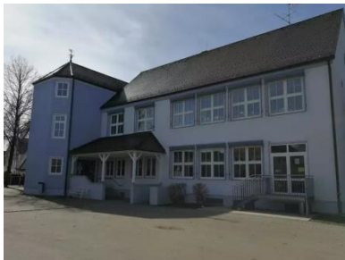
Schulhaus in Ober- ottmarshausen