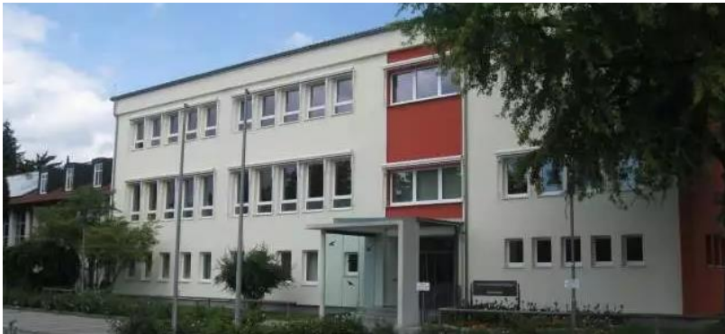
Schulhaus in Bobingen